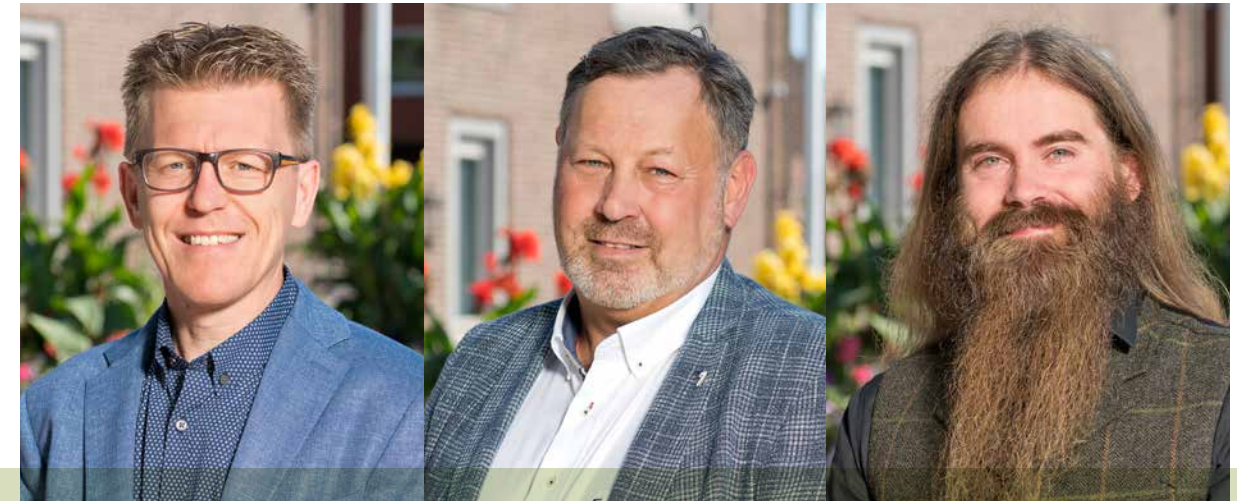
Wethouder Koert Kusters